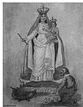
d Nossa Senhora Auxiliadora e Dom Bosco