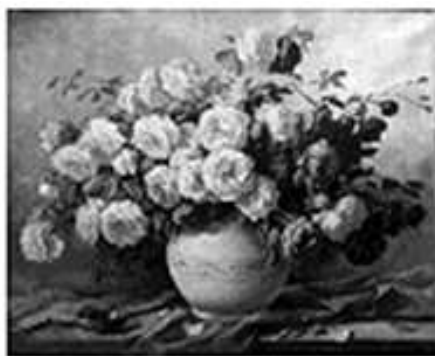
b Vaso de Flores