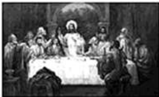
c A Santa Ceia