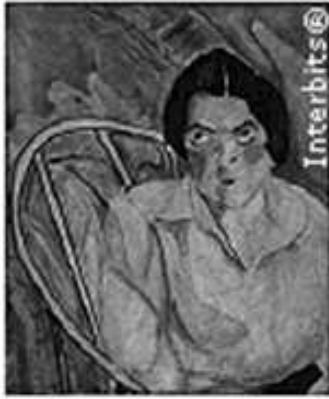
e A Boba