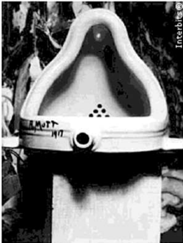
(Fonte – obra de Marcel Duchamp, fotografada por Alfred Stieglitz.)

A peça Fonte foi criada pelo francês Marcel Duchamp e apresentada em Nova Iorque em 1917.