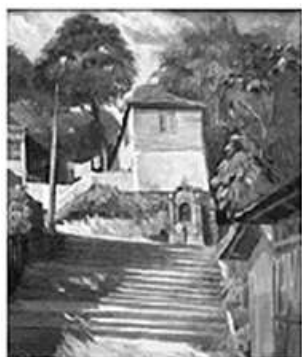
a Acesso a Monte Serrat – Santos

Em qual das obras a seguir identifica-se o estilo de Anita Malfatti criticado por Monteiro Lobato no artigo?