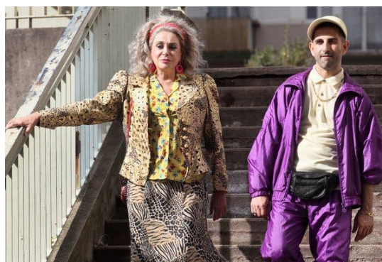
Catherine Deneuve and Kheiron in a scene from “Bad Seeds.” By Scott Tobias / Dec. 24, 2018

When the two try to pull the scam on another seemingly unsuspecting old gentleman, he not only chases Wael down and brings him back, but he also turns out to be a man named Victor (André Dussollier), who knew Monique when she was still helping people, not scamming them out of groceries. Turns out he’s trying