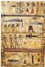
Représentation du processus de momification.

Les Égyptiens pensent que les morts continuent à manger et à s'habiller, voilà pourquoi on laisse de la nourriture, des objets de la vie quotidienne et des bijoux à côté des momies. Pour protéger ces trésors, des architectes construisent des labyrinthes et des pièges