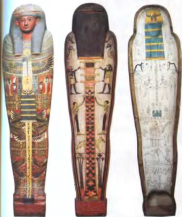
Sarcophage d'Imenemnet (cave, couvercle et intérieur de cave).

Au Louvre, on trouve aussi les statues d'un Chat assis et de Padimahès, prêtre de Bastet. Le chat est adoré en Égypte. La déesse Bastet, représentée par un chat, est très célèbre. Ses prêtres sont nombreux.